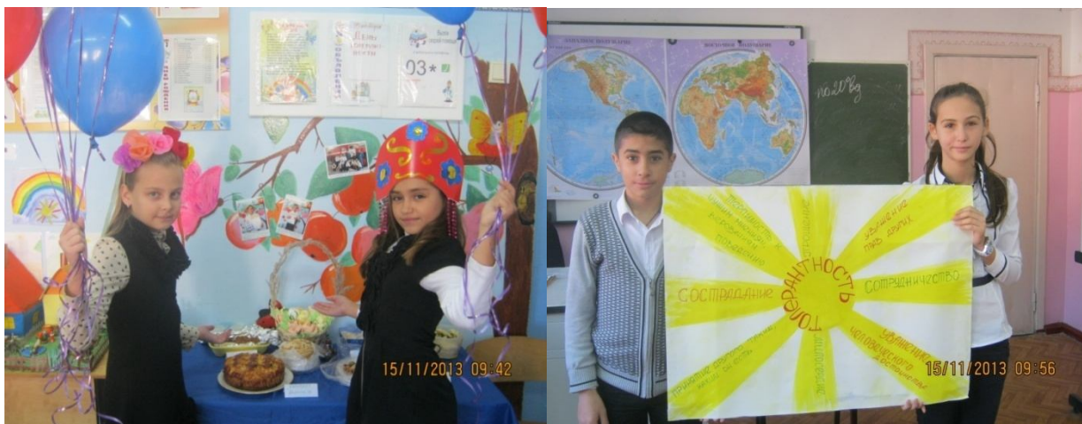
Линейка, посвященная Дню толерантности