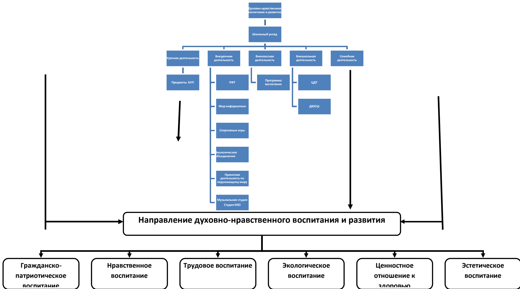
Таблица 1 Структура системы работы по духовно-нравственному воспитанию и развитию на ступени начального общего образования МБОУ СОШ № 19 с. Ольгинка